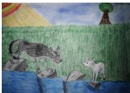
Il cane che traversava il fiume - I B I C