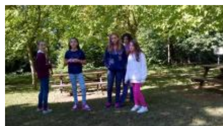
La classe I E