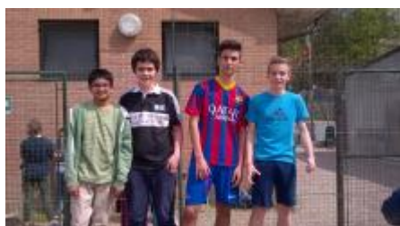
Il gruppo degli arbitri