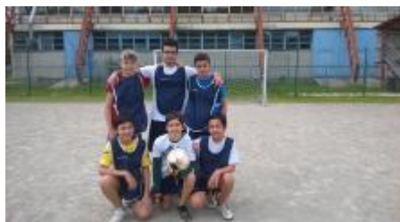
Anche loro in finale: la 2G

I rispettivi vincitori di queste partite sono state la 2'G che è andata in finale contro la 2'C, invece la 2'B si è classificata per il 3'/4' posto insieme alla 2'D.