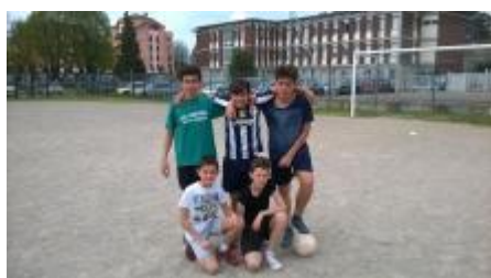
Gli sfidanti: 2D