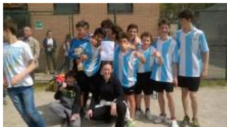
La squadra vincitrice, la 2C