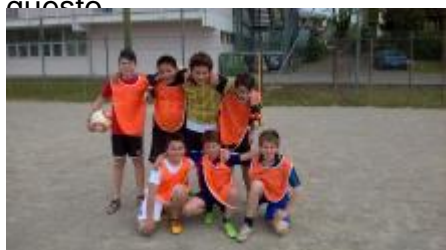
Gli sfidanti: 2B

Noi abbiamo partecipato con molto entusiasmo e speriamo di poter fare tanti altri tornei come questo.