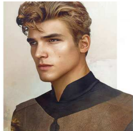
Principe arrogante (maggiore)