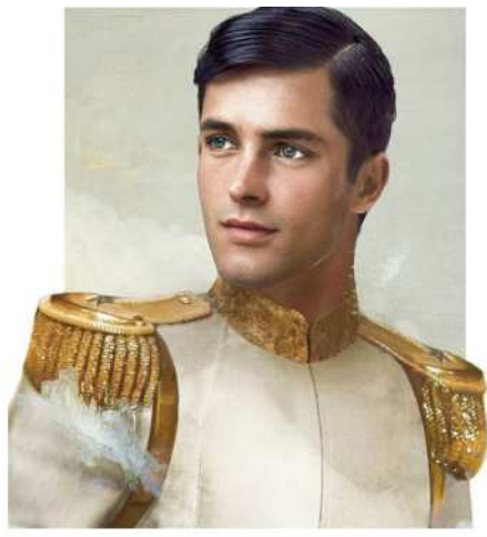
Principe gentile e pacifico (minore)