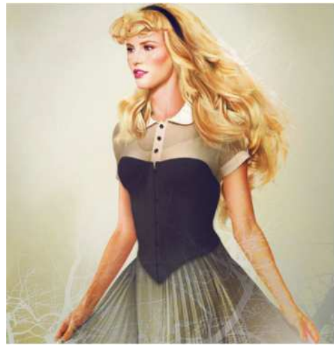
Principessa promessa in sposa